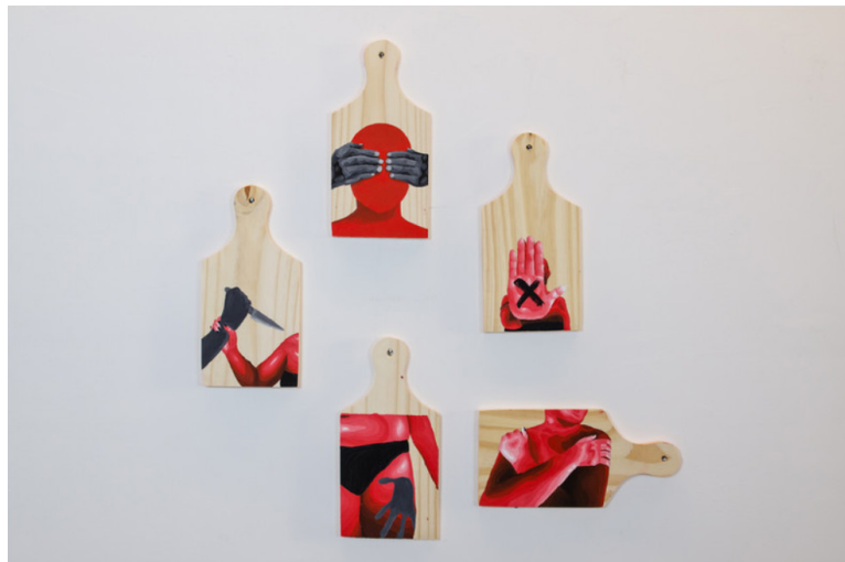
Figura 4 - Costela Mulher

Fonte: Melissa Anselmo, 2021. Exposição Poéticas Femininas na Periferia .