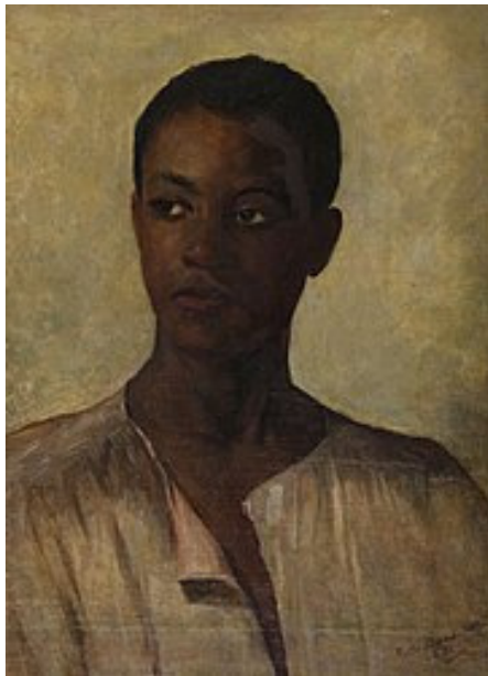
Figura 3 - Cabeça de Homem

Fonte: Antônio Rafael Pinto Bandeira, 1891, têxtil e óleo sobre tela.