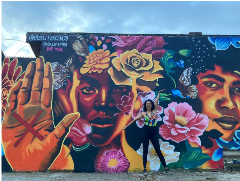
Figura 6 - Soul da Tribo das Mina